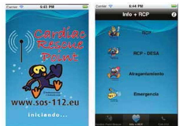
Capturas de pantalla del iPhone